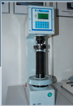
AQUASTYL SLOVAKIA, s. r. o., Považská Bystrica