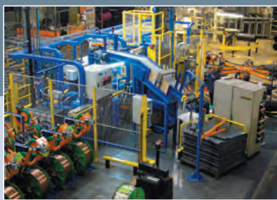
VIPO, a. s., Partizánske