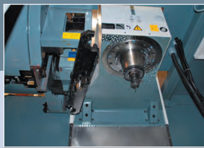
KOVOSVIT MAS, a. s., Sezimovo Ústí, ČR