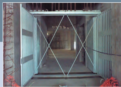
WERTHEIM, s. r. o., Dunajská Streda