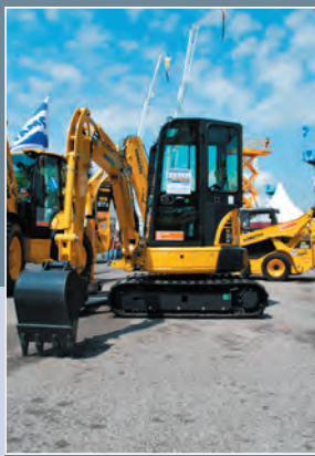
KUHN – Slovakia, s. r. o., Bratislava

Exponát: Automatická linka na výrobu pravouhlých viacdrôtových pätkových lán pre osobné automobilové plášte LIBEPAL V5 Výrobca: VIPO, a. s., Partizánske