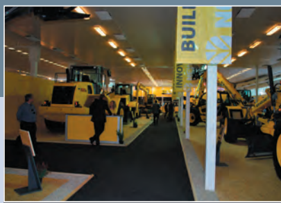
HYDREX, s. r. o., Hriňová