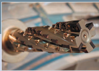
MCS, s. r. o., Bojnice