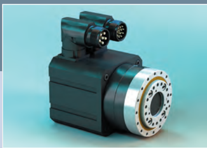
Spinea, s. r. o., Prešov