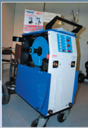
MAHE, s. r. o., Svit

Vystavovateľ: TechREG, s. r. o., Lučenec Výrobca: ORBIT MERRET, s. r. o., Praha, ČR Názov exponátu: Panelový merací prístroj OMB 452UNI