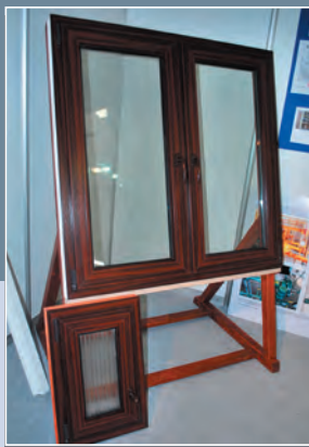
VÚSAPL, a. s., Nitra