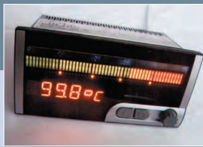
TechREG, s. r. o., Lučenec

Exhibitor: MCS, s. r. o., Bojnice Producer: Mitsubishi Materials Tokyo, Japan Exhibit name: SPX mill